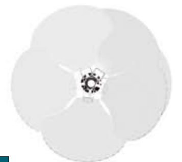
LYS vue de dessus / top part